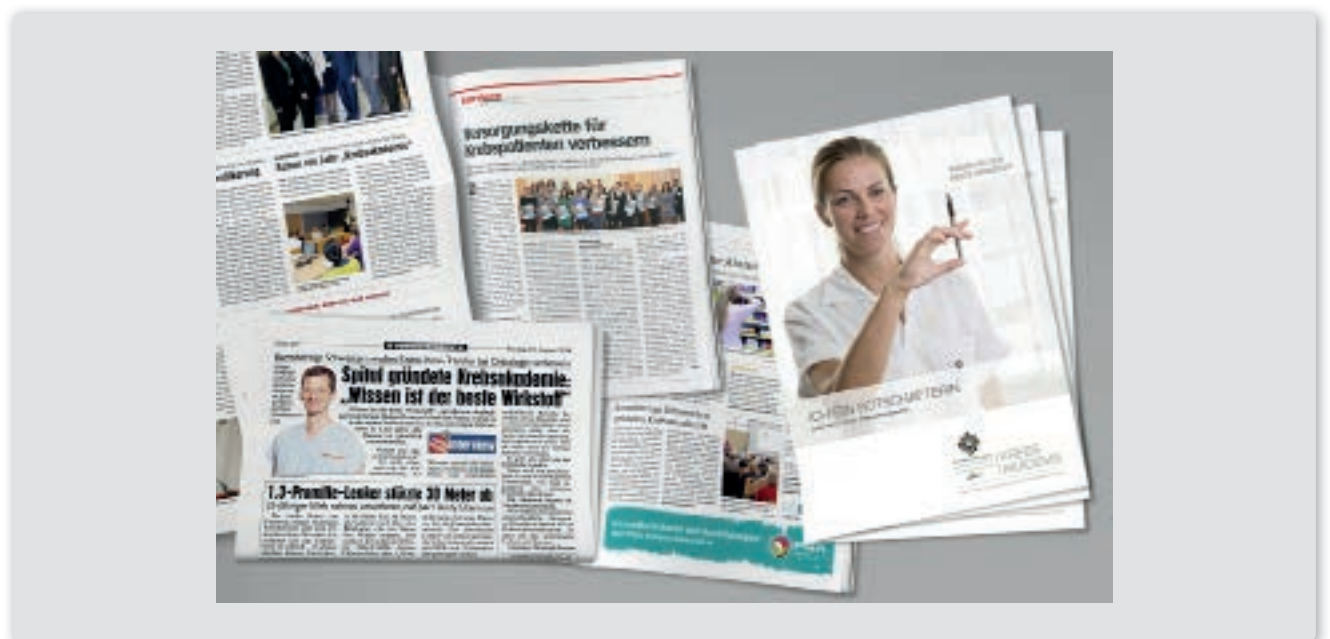
Oben: Bunter Marketingmix zur Akademie-Bewerbung: Einsatz von online Medien wie Website, Facebook, Newsletter und Promotionvideos ... Unten: ... sowie Printprodukte, Pressearbeit und Mitarbeiter als Botschafter auf Plakaten.