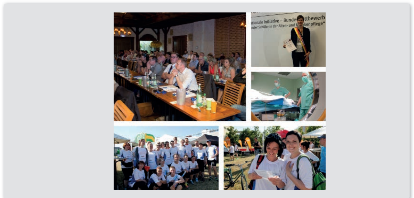
Oben: Kommentieren ist Mitsprache, ist sich auseinandersetzen, sich Gedanken machen und manchmal einfach ein netter Gruß. Unten: Vielfalt ist für ein interessantes Intranet Trumpf.